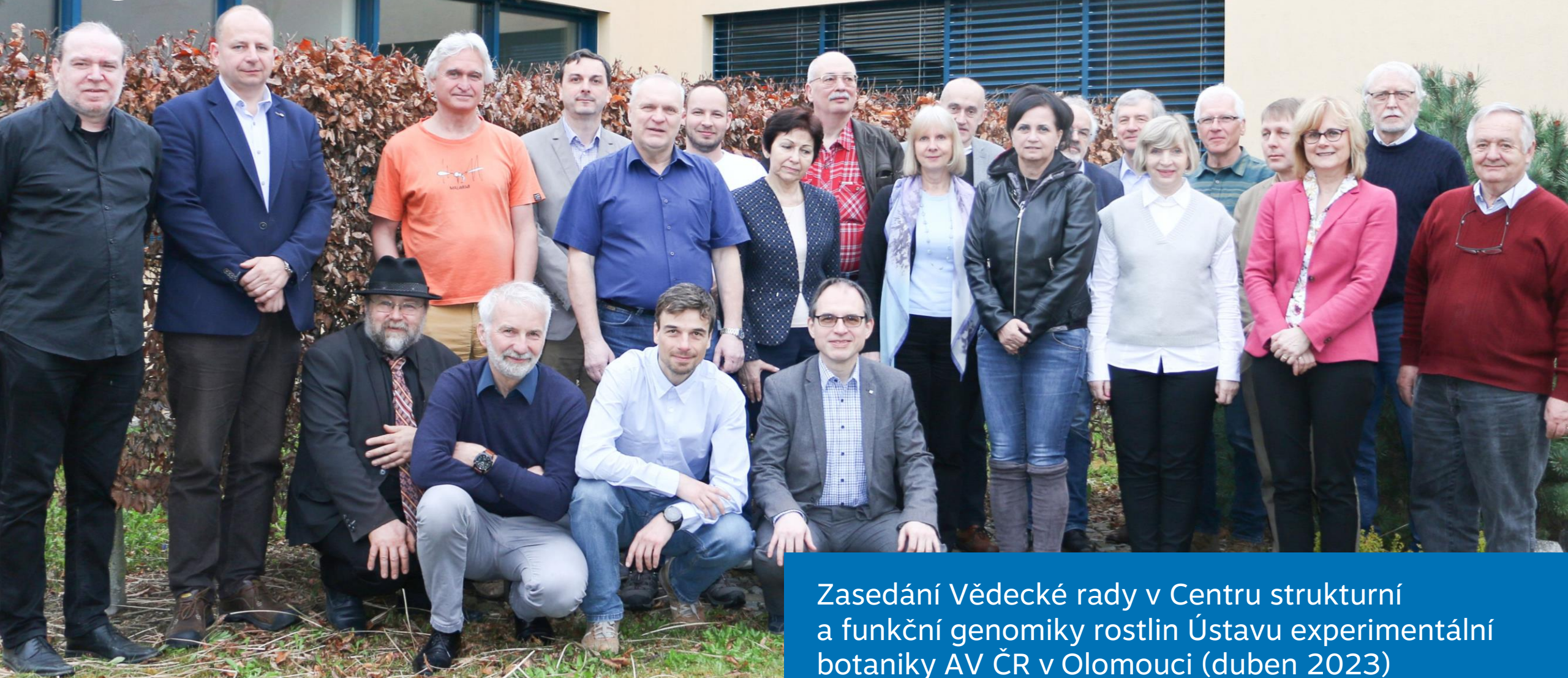
Zasedání Vědecké rady v Centru strukturní a funkční genomiky rostlin Ústavu experimentální botaniky AV ČR v Olomouci (duben 2023)