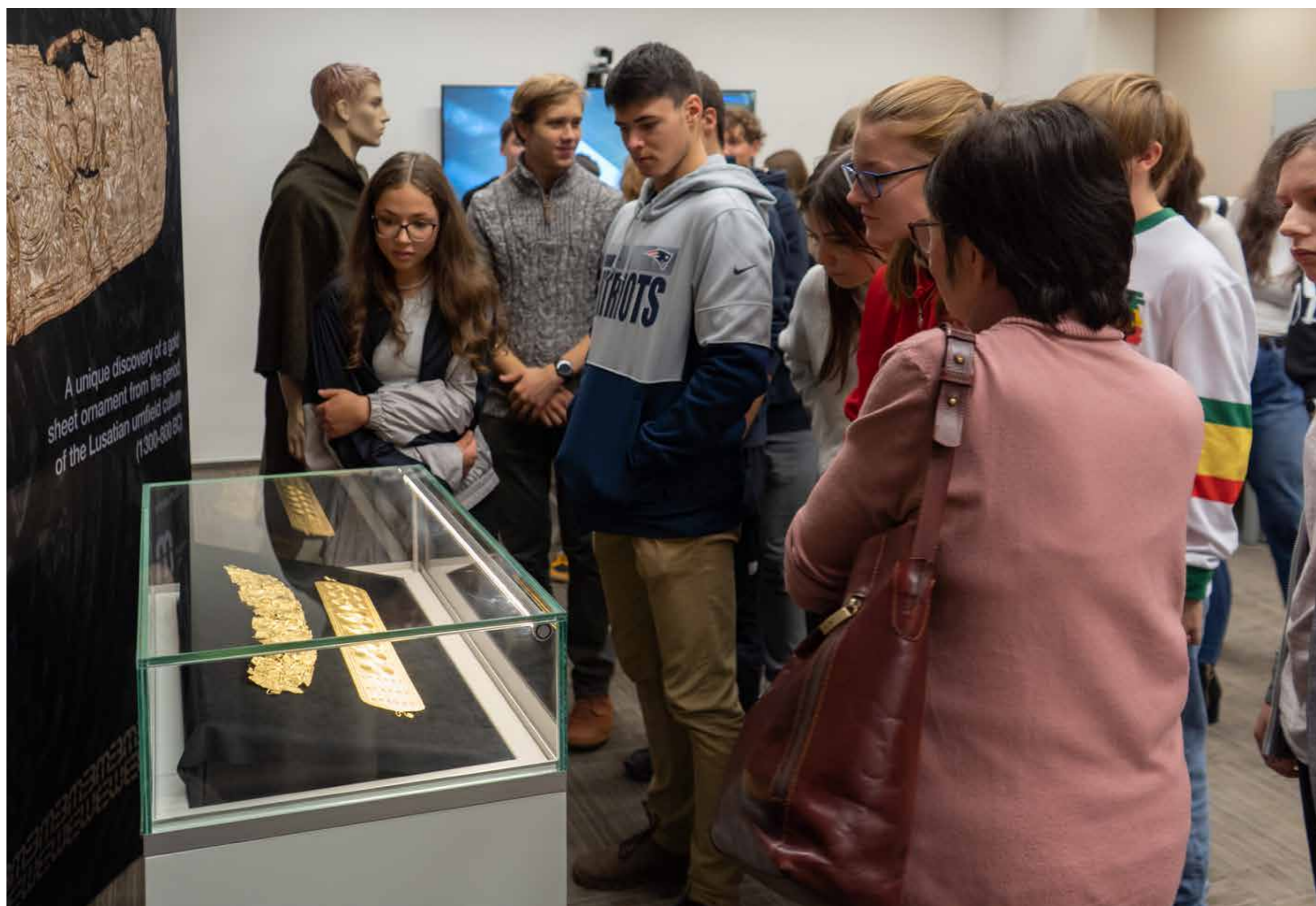
Představení nálezu široké veřejnosti v Archeologickém ústavu v Brně

i odborné veřejnosti došlo k obohacení regionální historie a popularizace archeologie. Aktivní prezentace nálezu a jeho průzkumu měla ohlas nejen v regionu Opavy, potažmo moravského Slezska, ale i celé České republiky s přesahem do evropské archeologie.