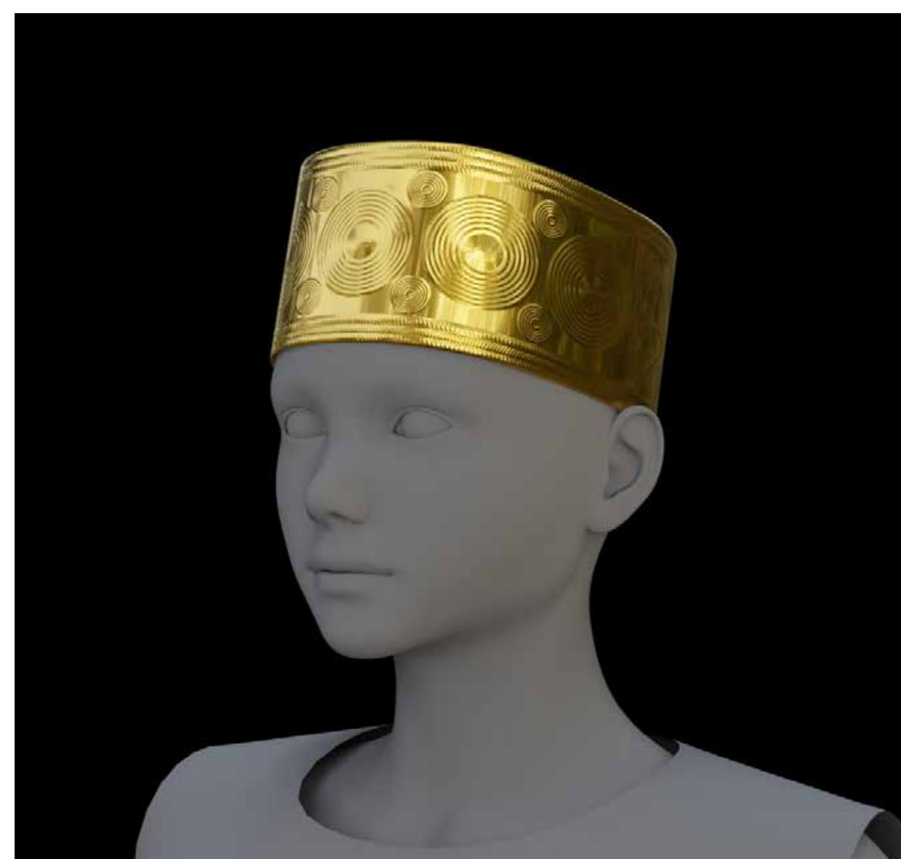
3D render možného funkčního umístění ozdoby