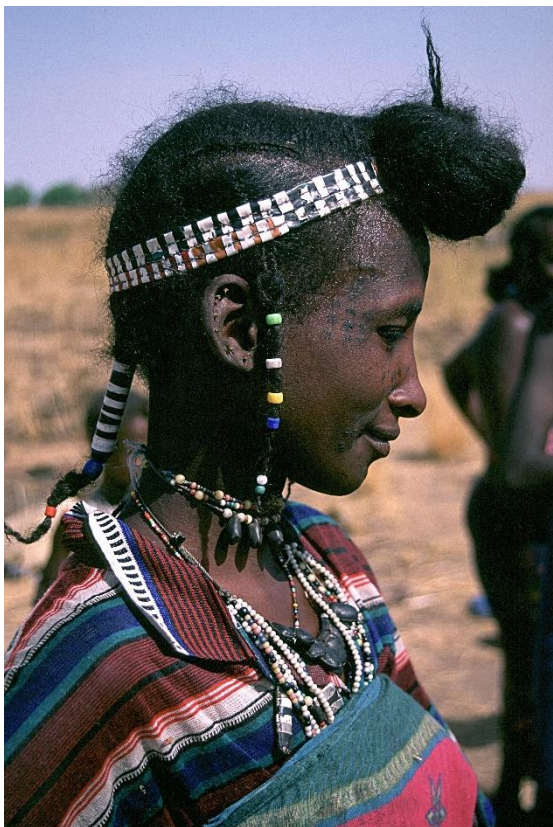
Specifickým typem účesu dívek u kočovných skupin zvaných Wodaabe v Nigeru a Čadu jsou vlasy na čele vyčesané do drdolu. Podobné účesy se objevují dokonce i na některých malbách v saharském skalním umění bovidiánského období. Na snímku dívka z oblasti Bongor ve středním Čadu.