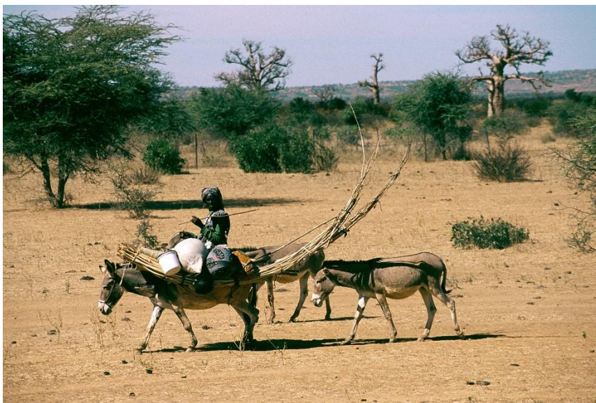
Základní strategií přežití všech pasteveckých skupin sahelu je transhumace. Jde o přesuny z míst nedostatku vodního zdroje a pastvin do užívanějších míst, což je dáno sezónním střídáním období sucha a období dešťů. Na obrázku fulbská žena se stanovými tyčemi a částí své domácnosti na oslu, střední Mali.